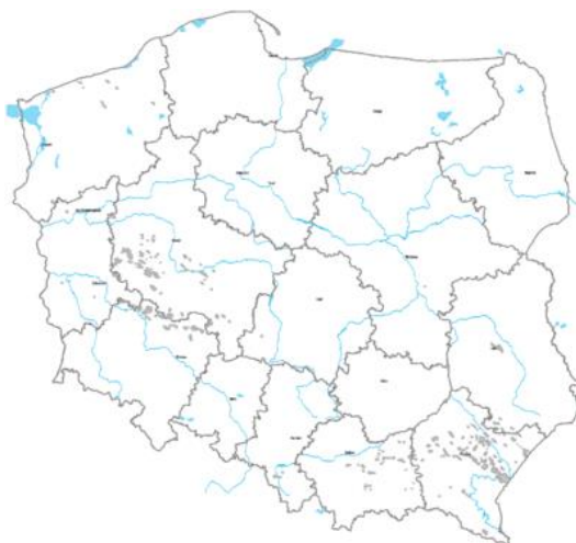
Rysunek 1. Złoża gazu ziemnego w Polsce (mapy koncesji geologicznych udostępnia Ministerstwo Środowiska[4])

W Polsce gaz ziemny wydobywa się głównie na Podkarpaciu (Przemyśl, Husów, Sanok) i Zapadlisku Przedkarpackim (wysokometanowy) w wyniku odmetanowywania kopalni węgla kamiennego w GOP, w Wielkopolskim (Odolanów, Kościan[5], Grodzisk Wielkopolski[6], Międzychód) oraz Lubuskiem (Drezdenko). Pierwsze odwierty zakończyły się powodzeniem i uruchomienie 13 kopalń planowane jest przez PGNiG już w 2012 roku. W ostatnim czasie rozpoczęły się nowe badania w celu potwierdzenia obecności ropy w okolicach Szamotuł oraz Trzcianki i Czarnkowa.